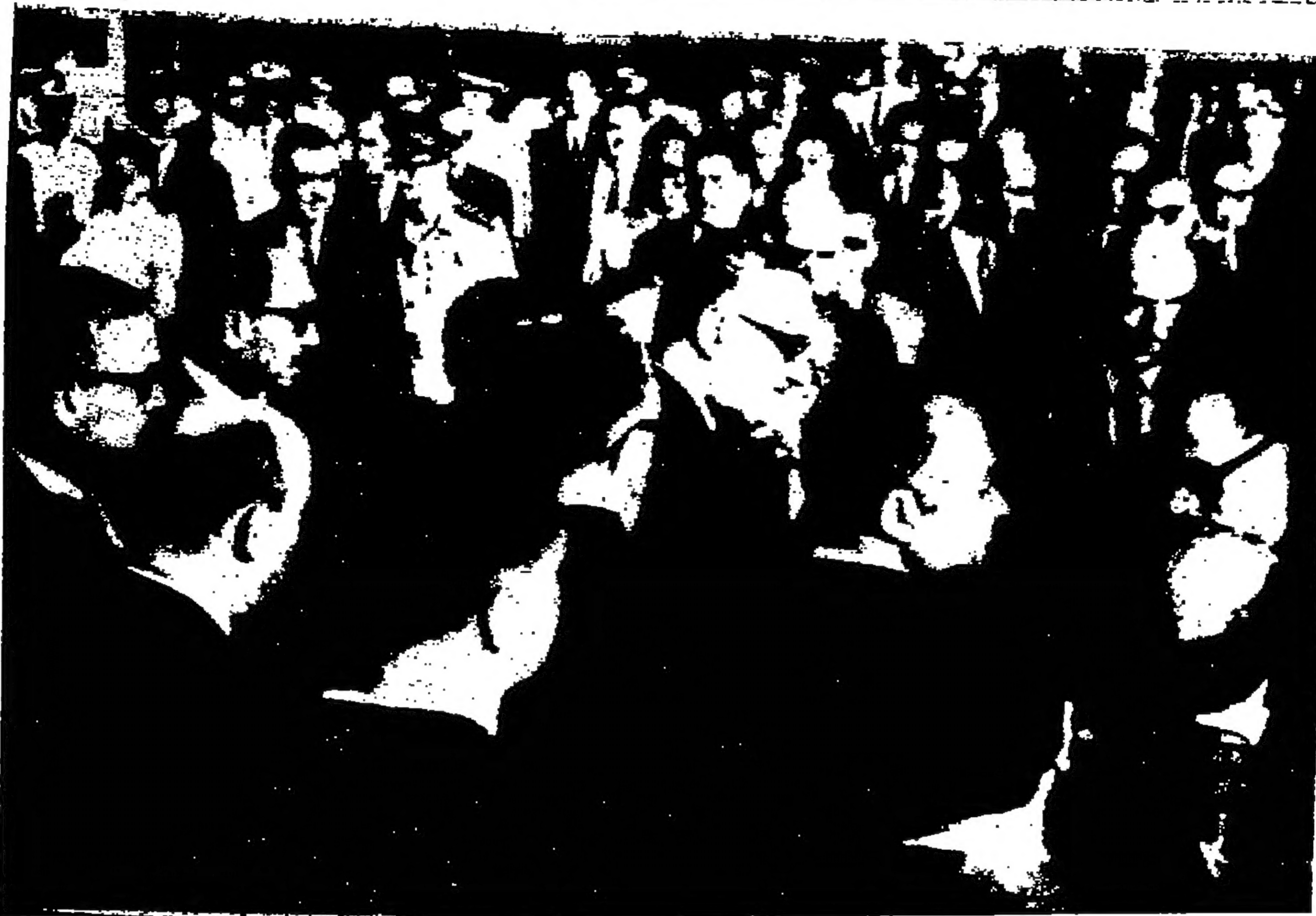
المرشد جمال عبد الناصر في طليعة المشيعين في جنازة والده المرحوم عبدالناصر حسين الذي توفي في مطلع هذا الاسبوع عن عمر يناهز الثمانين عاما في لا مسورة خلسة بالسفور من اليونان بريس «

عدن - اذاع راديو عدن بان المرشد كايد محمد احمد سافر الى الجزائر كحلح عسكري خاص . وجاء تعيينه هذا على اثر الاتفاقية الموقعة بين عدن والجزائر بعد زيارة الرئيس قطشان القاضي في نيوز الماضي . وقالت الاذاعة ان المرشد كايده اعلن تقبل سفره بان الحكومة العراقية وانت على تزويد اليمن الجنوبي بالأسلحة اللازمة التي وعدت بها خلال زيارة الرئيس الشامي للعراق . ومن تلبية اخرى وصلت الى اليمن الجنوبي بحة من القوات العسكرية السوفيات كتحريب الجيش الجنوبي على استعمال الاسلحة الروسية المفيدة التي تبناها روسيا محقا . اونس - رويتر - اعلن هنا ان الاتحاد القومي التونسي يعمل على احداث شحنة كبيرة من الملابس لارسالها الى ايتام اللاجئين الفلسطينيين في احد المخيمات في لبنان .